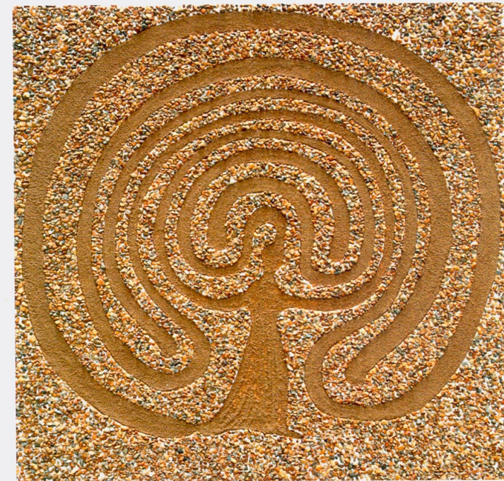
Mutter-Erde-Labyrinth in Schneverdingen von Ruthild Tillmann