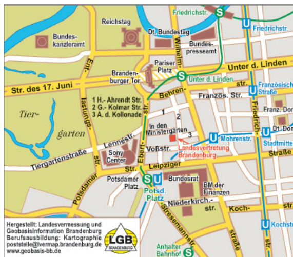
Tagungsort: 05.12.2011: Landesvertretung Brandenburg In den Ministergärten 3